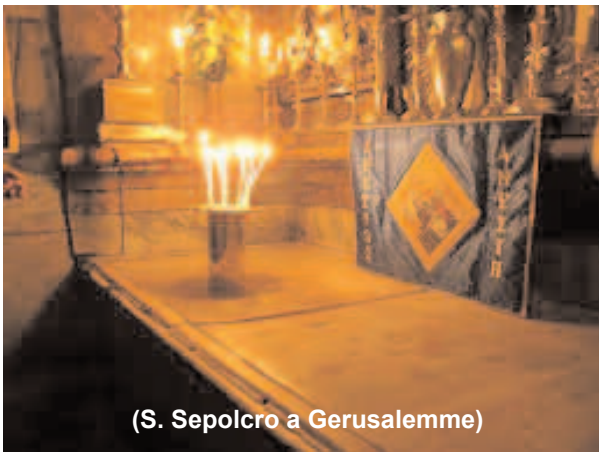
(S. Sepolcro a Gerusalemme)

Miei cari fratelli e sorelle, con gioia ed affetto rivolgo a voi gli auguri di buona e santa Pasqua.