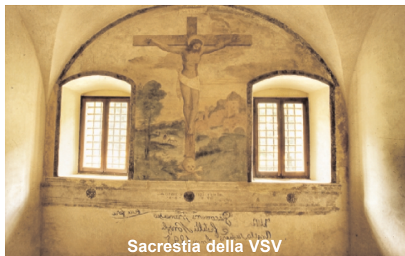
Sacrestia della VSV

Sempre ricchi di spunti i momenti che il gruppo liturgico vive nel suo cammino pastorale; lunedì 10 novembre 2014 alcuni aspetti importanti sono stati al centro dell'incontro.