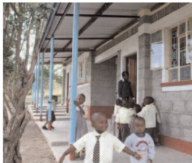
Scuola dell'Infanzia di Sirima