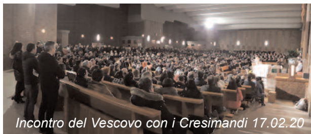
Incontro del Vescovo con i Cresimandi 17.02.20