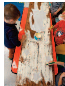
Bambini dell'Asilo che dipingono